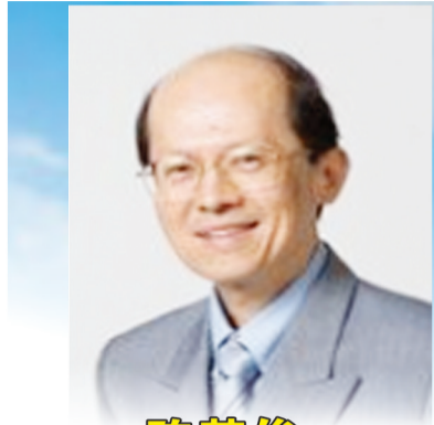
新加坡陈英俊医生供稿